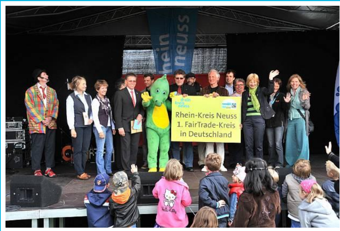
Auszeichnung 1. FairTrade Kreis in Deutschland